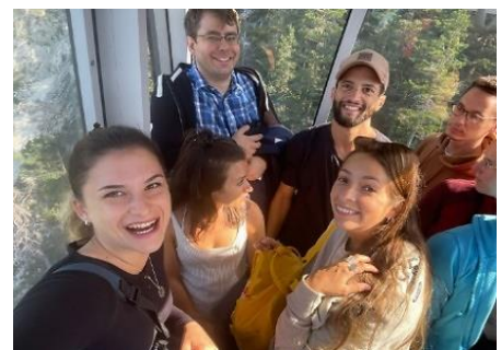
Erasmusprogramm am Weg zur Eisriesenwelt