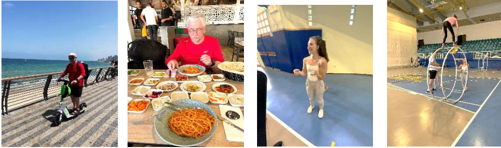
Jerusalem am 13.6.2022