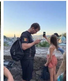
LSO Halle, Spaziergang über den Mönchsberg